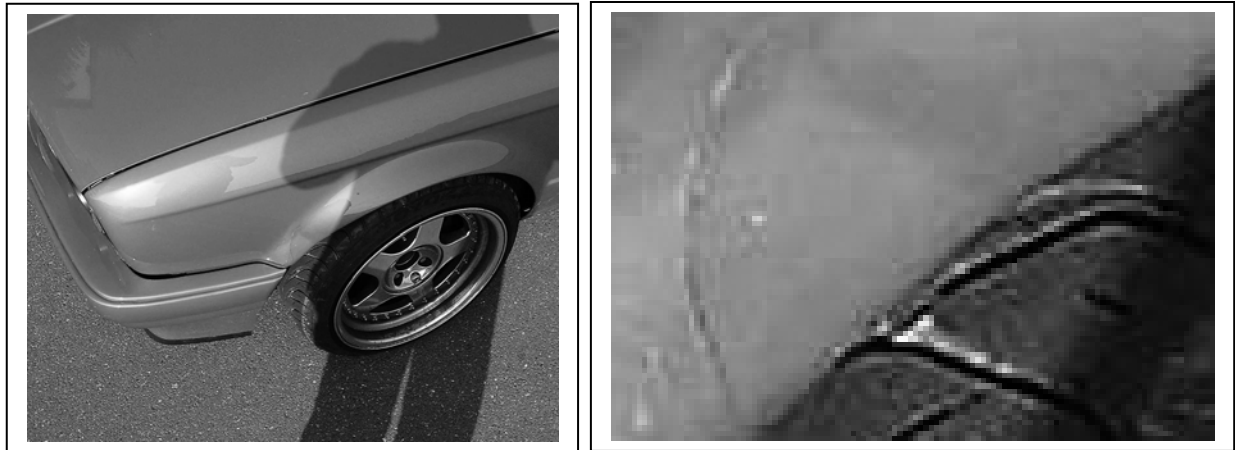
Abb.2: Ausschnittsvergrößerung bei zu geringer Auflösung

Digitale Bilder sollten deshalb immer anhand der Original-Kamera-Bilddateien ausgewertet werden.